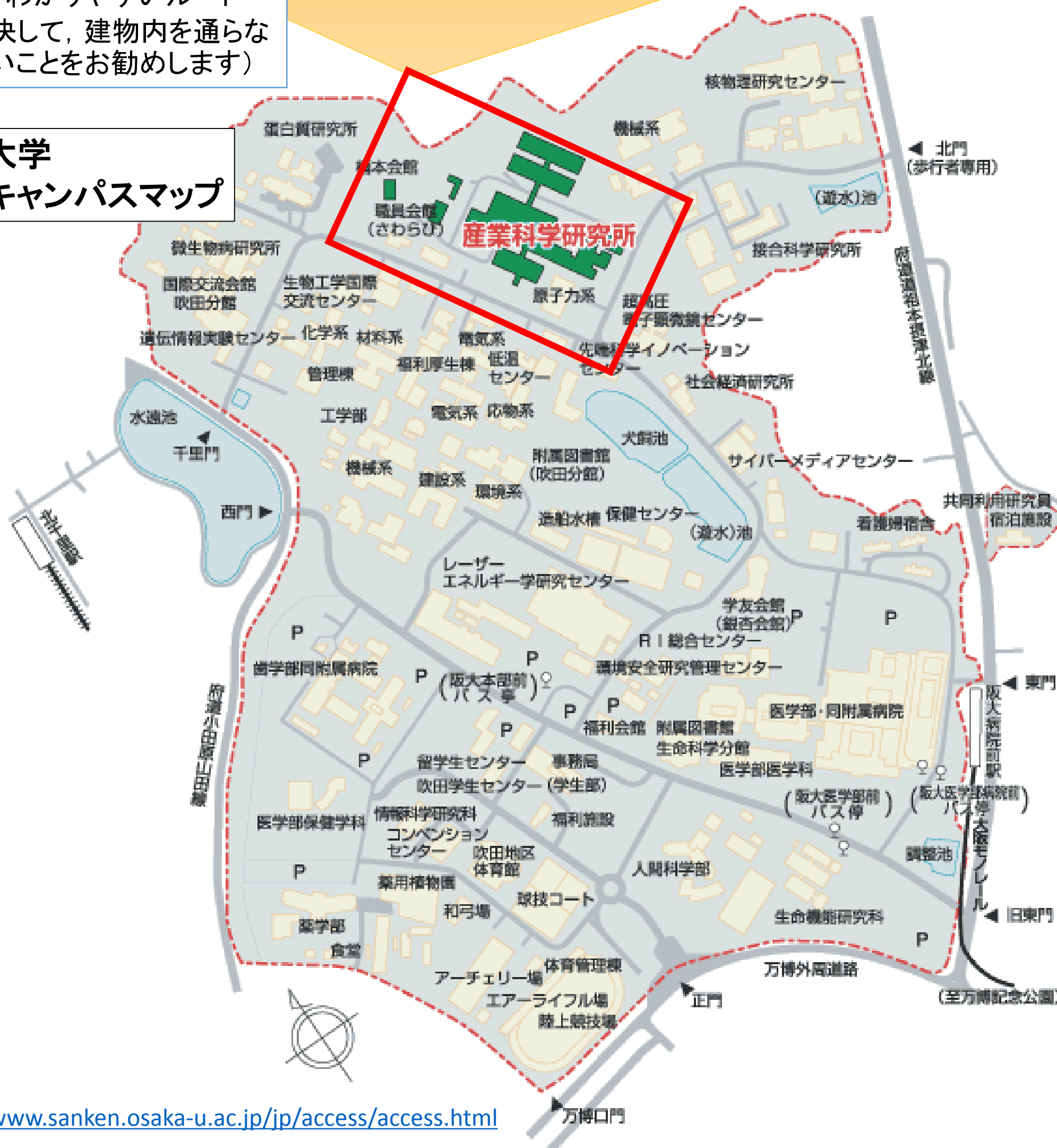
大阪大学 吹田キャンパスマップ